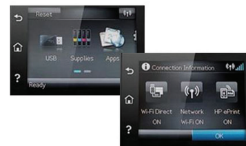
Imprimante multifonction HP Color LaserJet Pro M277dw