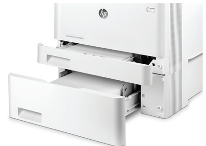
HP LaserJet Pro M452dn mit optionaler 550-Blatt-Papierzuführung