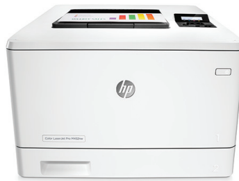
HP LaserJet Pro M452dn

Ideale Druckleistung und zuverlässige Sicherheit für Ihre Arbeitsweise. Mit diesem leistungsfähigen Farbdrucker können Sie Aufgaben schneller erledigen und Ihre Daten vor Bedrohungen schützen. 1 Original HP Tonerkartuschen mit JetIntelligence sorgen für eine höhere Reichweite. 2