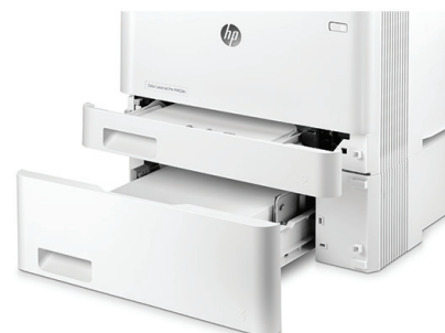
HP LaserJet Pro M452dn avec bac de 550 en option